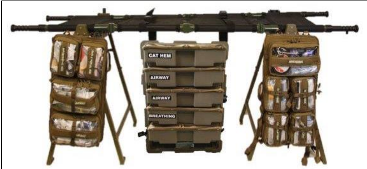
Casualty Sustainment 2 (CS-2) – Patient Treatment Station Polowe Stanowisko Zabiegowe