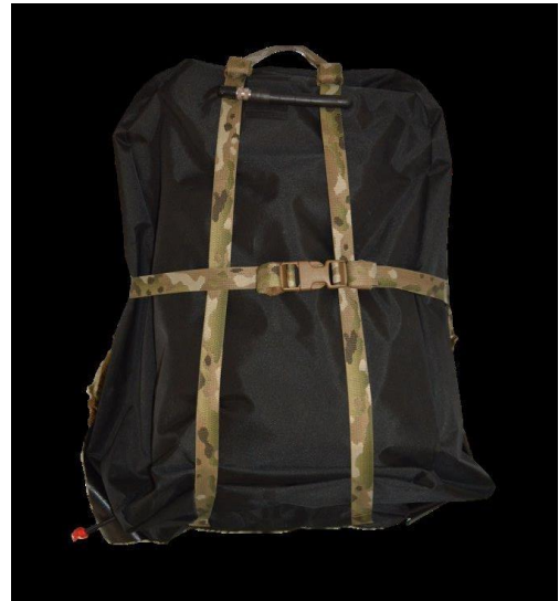
Field Care 5 Waterproof (FC-5 WP) - Combat Paramedic Pack Waterproof Variant, Wodoodporny Bojowy Plecak Ratowniczy, złożony (powyżej)

Pakiet Field Care 5 Waterproof - Combat Paramedic Pack Waterproof Variant (FC-5 WP) stanowi połączenie plecaka MYSTERY RANCH z wodoodpornym zewnętrznym pokrowcem. Uzyskane w ten sposób rozwiązanie jest w pełni przystosowane do operacji nurkowych (posiada zamek Aquaseal). Pokrowiec został wykonany z wodoodpornego w 100% materiału ze zintegrowanym ciśnieniowym zaworem bezpieczeństwa, jak też zaworem ustnikowym do napełniania pokrowca powietrzem, gdy jest to wymagane. Pakiet FC-5 WP przeznaczony jest do nurkowania na głębokościach do 25 metrów.