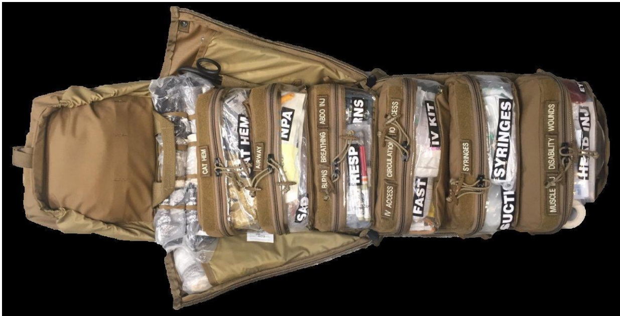
Field Care 4 (FC-4) - Combat Medic Pack Bojowy Plecak Medyczny, rozłożony (powyżej) i złożony (poniżej)

Wprowadzenie wytycznych TACTICAL COMBAT CASUALTY CARE (TCCC – TC3), tj. taktycznej pomocy rannym na polu walki pozwoliło na zredukowania śmiertelności na polu walki do 3%.