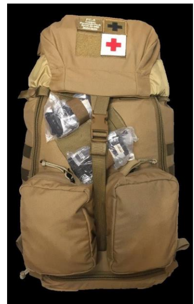
Field Care 5 (FC-5) - Combat Paramedic Pack, Bojowy Plecak Ratowniczy, złożony (powyżej)