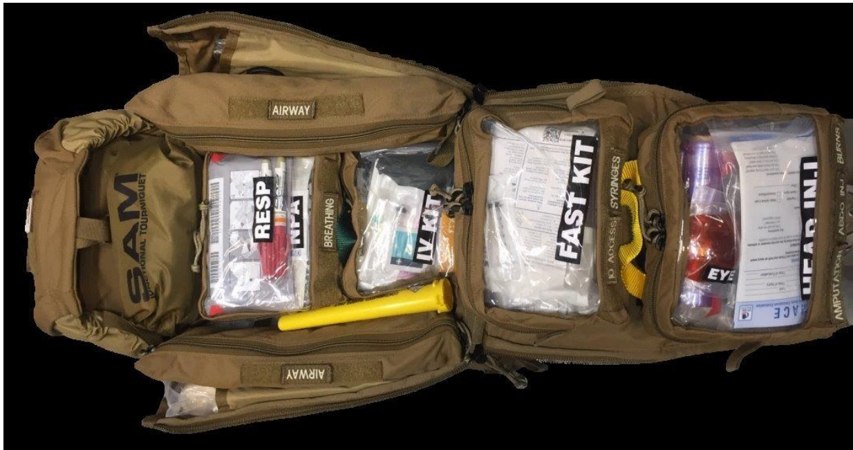
Field Care 5 (FC-5) – Combat Paramedic Pack, Bojowy Plecak Ratowniczy, rozłożony wchodzący również w skład FC-5 WP

W wariantcie wodoodpornym dostępne są również inne pakiety wchodzące w skład systemu Pre-Hospital Care Solutions m.in. FC-1 - Individual First Aid Kit (IFAK), indywidualny pakiet pierwszej pomocy.